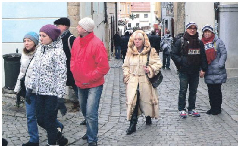
PLNO. V ulicích Českého Krumlova od středy zavládl rušno. Návštěvníci se tam sjíždějí na oslavy Silvestra a dnů voina využívají k prohlídce města i zámků. Také v restauracích se má personál co otáčet.