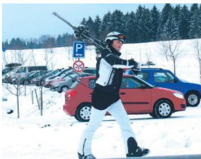
SKI AREÁL LIPNO. Lipno s sněhem příliš neoplyvá, ale zprovoznění sjezdovky nabízí kvalitní lyžování.